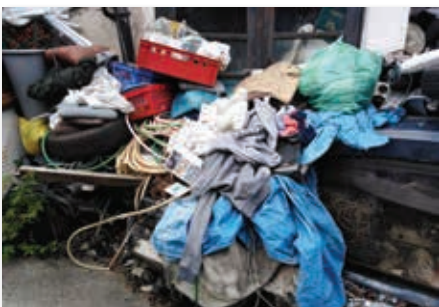
Takto je lemována jediná přístupová cesta k nemovitosti Těšenov č.p. 46

Tři soupravy s přívěsy odvezly po silování k likvidaci cca 30 nepojízdných vozidel v různém stupni poškození. Celkové náklady po odečtení příjmu za kovové součásti vozidel činil 36 tis. Kč, boj s odpady shromažďovanými p. Haškem však neskončil, druhou částí k řešení jsou pozemky ve vlastnictví p. Haška, kde také během několika let nashromáždil neskutečné množství