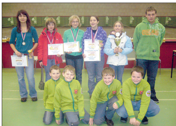
Střelci Horní Cerekve a Černovic na soutěži v Plzni

Skončil rok, je dobré provést jeho hodnocení. Po stránce dosažených výsledků žáků a dorostenců našeho sportovně střeleckého kroužku AVZO byl velice úspěšný. Mládež se zúčastnila mnoha závodů a soutěží včetně bojů o mety nejvyšší – o tituly Mistra České republiky, a to jak ve střelbě ze vzduchové, tak i malorážové pušky. A právě Mistrovství ČR ve střelbě z malorážky proběhlo na konci srpna zde na střelnici v Horní Cerekvi.